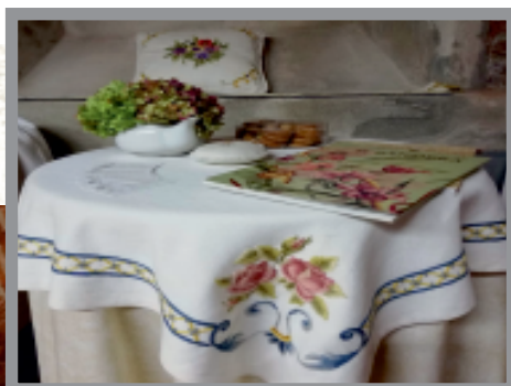
Alcuni manufatti dell'Associazione Castellinaria